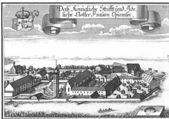
Kupferstich von Michael Wening um 1706

Um 782 wurde vom Bayernherzog Tassilo III. aus dem Geschlecht der Agilolfinger ein Frauenkloster gegründet. Im Jahre 857 stand die "Selige Irmengard" dem Kloster als Äbtissin vor. Sie war die Tochter von Heinrich dem Deutschen und eine Enkelin von Karl dem Großen. Geboren wurde sie im Jahre 833 und starb am 16. Juli 866. Irmengard erhielt von ihrem Vater den Auftrag, hier ein adeliges Damenstift der Agilolfinger nach den Regeln des Hl. Benedikt zu errichten.