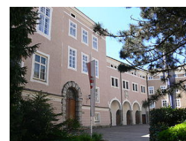
Chiemseehof in Salzburg

Das Bistum Chiemsee zwar hier seinen Sitz, jedoch residierte der Bischof nicht auf der Insel sondern im Chiemseehof in Salzburg. Seine Aufgaben als Weihbischof waren unter anderem Kircheneinweihungen und Visitationen in den Pfarreien. Das Archidiakonat Chiemsee umfasste neben dem westlichen Chiemgau auch die in Tirol gelegenen Sprengel der Erzdiözese Salzburg mit den Städten Kufstein, Rattenberg und Kitzbühel.