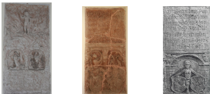
Epitaphe Rehlinger und Meiting in der Pfarrkirche Chieming