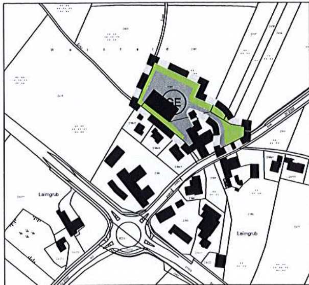
Änderungsplan M 1: 5.000