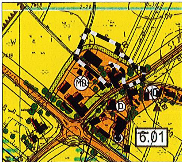
bestehender Flächennutzungsplan mit Änderungsbereich M 1: 5.000